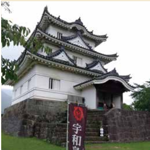
▲寛文天守は重要文化財に指定