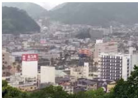
▲宇和島城から市街地を眺望