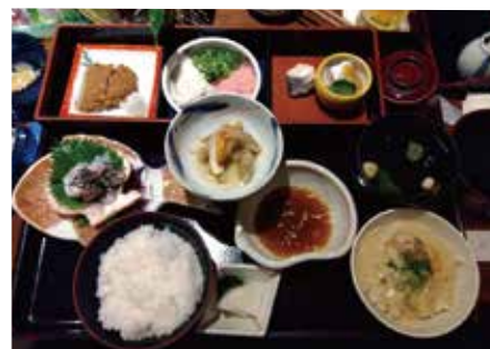
▲かどや駅前店の伊達御膳